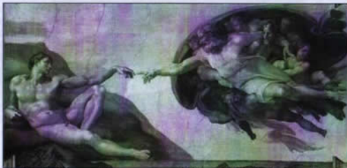
Michelangelo Buonarroti, La creazione di Adamo (1511 circa) – Cappella Sistina