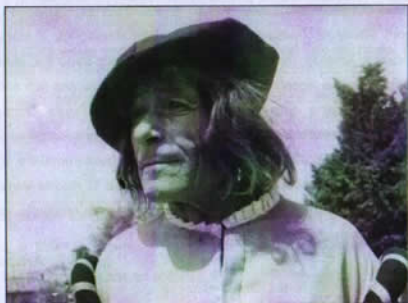
Giuseppe Guerri - L'Eroina di Monticchiello , 1967