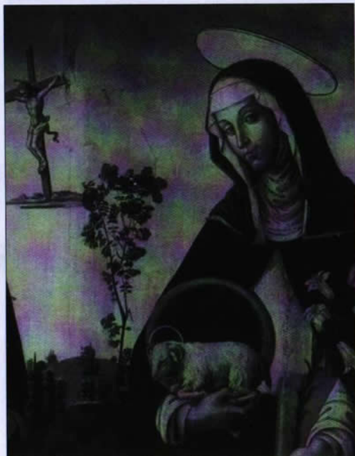
S. AGNESE SEGNI da Montepulciano, 1268-1317 20 aprile, vergine e monaca