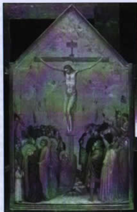
Giotto di Bondone, Crocifissione (1315 circa) - Gemäldegalerie, Berlino

A capo di quelli rimasti fedeli si pose un avvocato del Missouri, Joseph Franklin Rutherford (1869-1942), che trasformò profondamente la setta, e le diede un'organizzazione fortemente autoritaria. Stabili la sede centrale a Brooklyn (New York), e nel 1931 fece un congresso internazionale nel quale impose ai suoi seguaci di chiamarsi TdG. E per allontanarli sempre più dal vero cristianesimo proibì il crocifisso a due bracci e tutte le feste religiose, comprese Natale e Pasqua. Rutherford sfruttò a fondo la potenza della stampa, diffondendo in tutto il mondo libri, opuscoli e riviste in centinaia di milioni di copie. Fondò moltissimi "centri missionari" (anche in Italia, con sede centrale a Roma), e impegnò i suoi seguaci a dedicare tutto il tempo disponibile per conquistare altri aderenti. Affermò che il primo TdG era stato Abele e non mancò di fare profezie, regolarmente smentite dai fatti. Disse che nel 1925 sarebbero tornati in terra Abramo, Isacco, Giacobbe, e alcuni profeti; per accoglierli fece costruire una splendida villa, che poi tenne per se. Aggiunse che milioni di persone viventi in quell'anno non sarebbero più morte e avrebbero visto l'inizio del regno di Geova. Ma anch'egli morì nel 1942, e gli