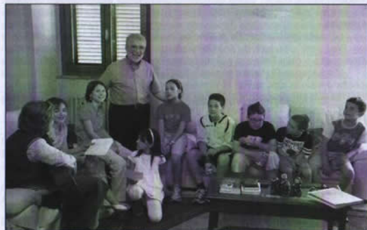
Il Vescovo Cetoloni e i bambini di Monticchiello (14 giugno 2011)

Vi saranno sussidi e indicazioni per prepararlo, per fare un calendario generale e per precisare obiettivi e modi, ma fin d'ora pongo sotto la benedizione di Dio e propongo alla vostra buona volontà questo impegno per tutti.