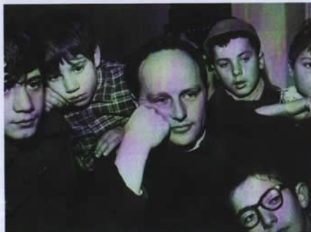
Don Lorenzo Milani, il priore di Barbiana (Firenze)

Caro direttore, a rileggere l'articolo 3 della Costituzione, "Tutti i cittadini hanno pari dignità sociale..." mi vengono i bordoni. Oggi non volevo parlarvi del paria d'Italia, ma d'un'altra cosa. C'è questa legge 991 (legge per la montagna che garantisce finanziamenti e agevolazioni fiscali, ndr) che pare adempia la promessa del secondo paragrafo dell'articolo 3: "... è compito della Repubblica rimuovere gli ostacoli di ordine economico e sociale che limitano di fatto la libertà e l'eguaglianza dei cittadini". A te, cittadino di città, la Repubblica non regala un milione e mezzo, né ti presta i soldi. A noi sì. Basta far domanda... Infatti eravamo già a buon punto perché un proprietario mi aveva promesso di concederci una sua sorgente assolutamente inutilizzata e inutilizzabile per lui, la quale è ricca anche in settembre e sgorge e si perde in un prato poco sopra alla prima casa che vorremmo servire. Due settimane dopo, un piccolo incidente.