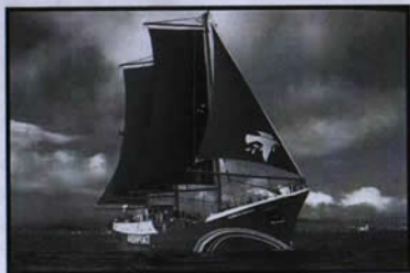
Rainbow Warrior – Nave ammiraglia di Greenpeace