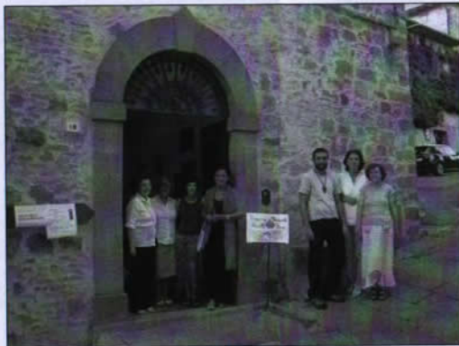
Fiera solidarietà 2009