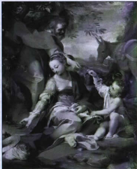
Federico Barocci - Il riposo durante la fuga in Egitto (Madonna delle ciliegie) 1570-73, olio su tela, cm 133x110 - Città del Vaticano, Musei Vaticani