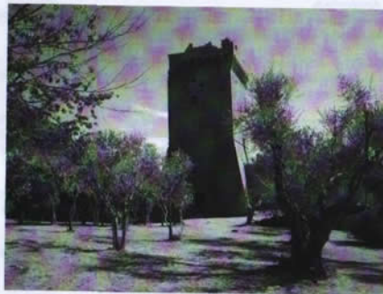
Cassero di Monticchiello, XIII secolo