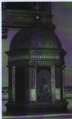
Tabernacolo cinquecentesco, in legno intarsiato, presente nella Pieve di Monticchiello

PS: Hai proprio ragione: i tramonti sono bellissimi da Monticchiello, e, soffermarsi più spesso al loro cospetto, allarga il cuore.