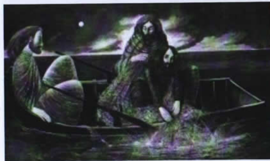
Bruno Grassi, "Pesca Miracolosa" (Olio su tela 385x 185, 2004)