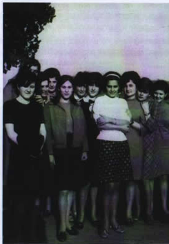
Ragazze Monticchiellesi anni 60'