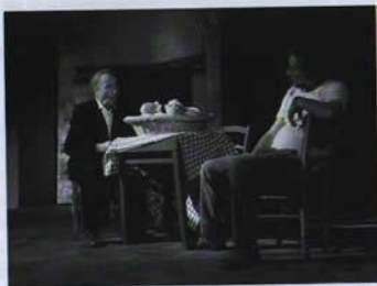
Foto di una scena di Fola 2004 , spettacolo del Teatro Povero di Monticchiello