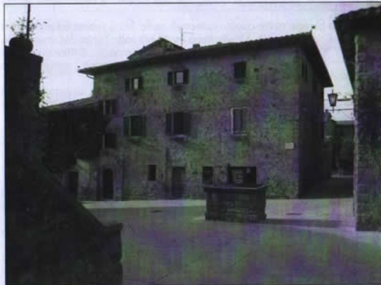
Piazza S.Martino, Monticchiello (provenendo da Piazza della Commenda)