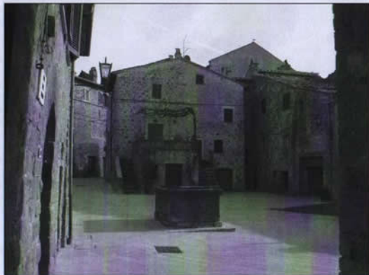
Piazza S.Martino, Monticchiello (provenendo da via del Piano)

In questo anno e mezzo di catechismo, mi sono resa conto della grazia immensa che è nella fanciullezza. In queste vite acerbe sono racchiusi piccoli cuori che battono per tutto quello che è bello, che è vero e che è giusto; cuori capaci di stupore e aperti a mille domande. Piccoli cuori capaci di credere con semplicità che il tuo amore è più grande di tutto.