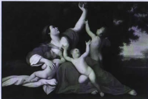
La Carità - Marcantonio Franceschini

«Da questo tutti sapranno che siete miei discepoli, se avrete amore gli uni per gli altri» (Gv 13, 35). Ufficialmente, tutti sanno che siamo cristiani perché siamo stati battezzati, ed esiste in qualche archivio parrocchiale il nostro atto di battesimo. Da questo punto di vista, in Italia siamo tutti «cristiani». Anche gli uomini della mafia, della camorra e della 'ndrangheta. Anche gli spacciatori di droga. Anche i sequestratori di persone. Anche i violenti e gli imbroglioni di ogni tipo e misura. Anche chi si è fatto depennare dai registri! Da un altro punto di vista la gente sa che noi qui presenti siamo cristiani («credenti e praticanti», si dice) perché andiamo a Messa. Ma Gesù, nell'indicare qual è il segno di riconoscimento autentico dei «suoi discepoli», non parla né di battesimo né di Messa della domenica... E queste sue parole devono farci riflettere, seriamente. A meno che non pensiamo di poter dire «cristiani» (e la cosa vale a maggior ragione se siamo preti, frati o suore...) indipendentemente da ciò che dice Gesù Cristo.