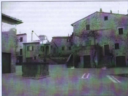
Piazza S. Martino, Monticchiello (provenendo da via di Mezzo)