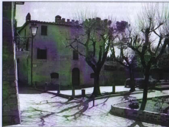
Piazza Borghesi, Monticchiello

Dobbiamo storicamente affermare che la Toscana sotto il Granduca Leopoldo II di Lorena (Canapone) non aveva subito angherie o soprusi. Leopoldo II era un governatore lungimirante e umano e dobbiamo a lui molte riforme che per quei tempi erano all'avanguardia; ricordiamo la bonifica della val di Chiana, la costruzione dei poderi con la colombaia che possiamo tutt'ora ammirare, la lotta contro la malaria in Maremma e altro.