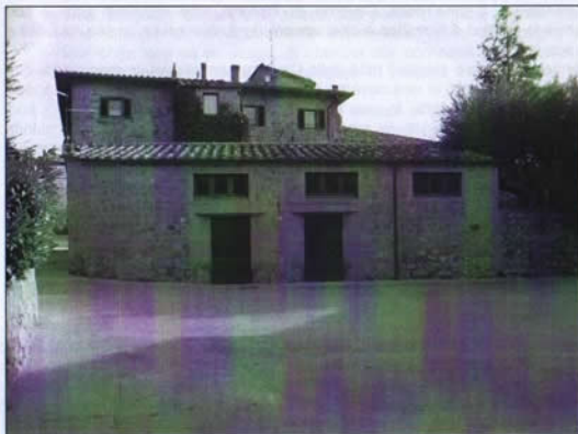
Piazza del Piano, Monticchiello