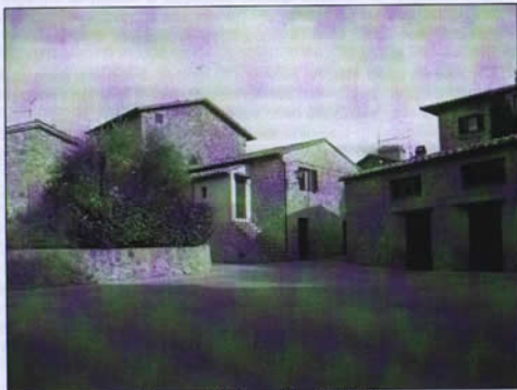
Piazza del Piano, Monticchiello