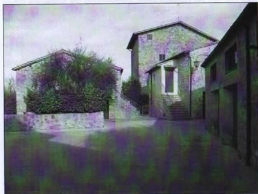
Piazza del Piano, Monticchiello

Le poche cose che contano devono essere tenute d'occhio, altrimenti si smarrisce la rotta e si trova assurda la vita.